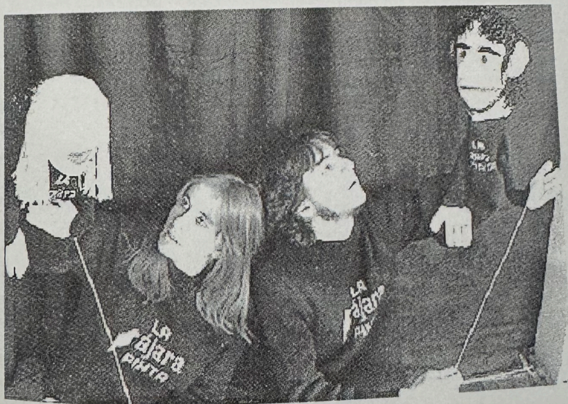
LA PAJARA PINTA (Ecuador)