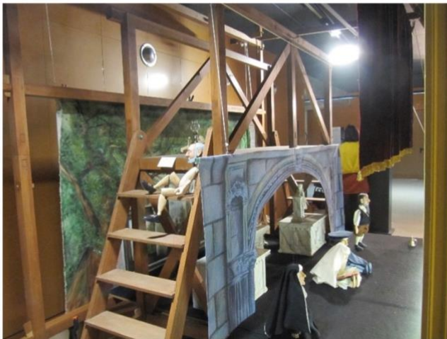
Interior del teatrillo con el puente de manipulación.

Les comparto capturas de pantalla de la página de la WEPA con los dibujos de Francisco J Cornejo, reconstrucción de la máquina real