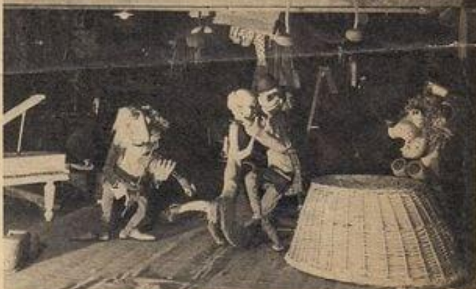
The Bairds live in a wonderland where elfin figures are born on a drawing-board, character-molded with affection, and taught to dance!