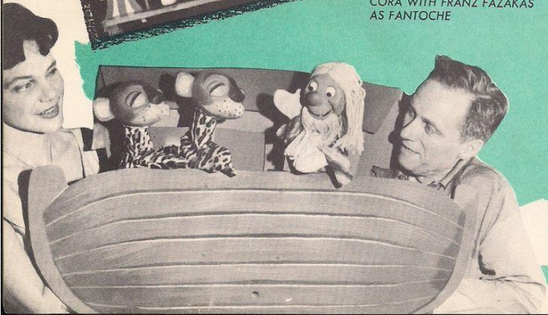
NOAH AND THE ARK