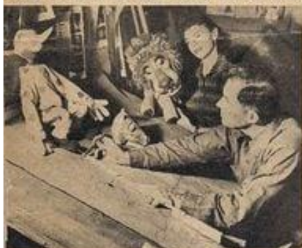
That's Charlemagne, of course, above and at left.