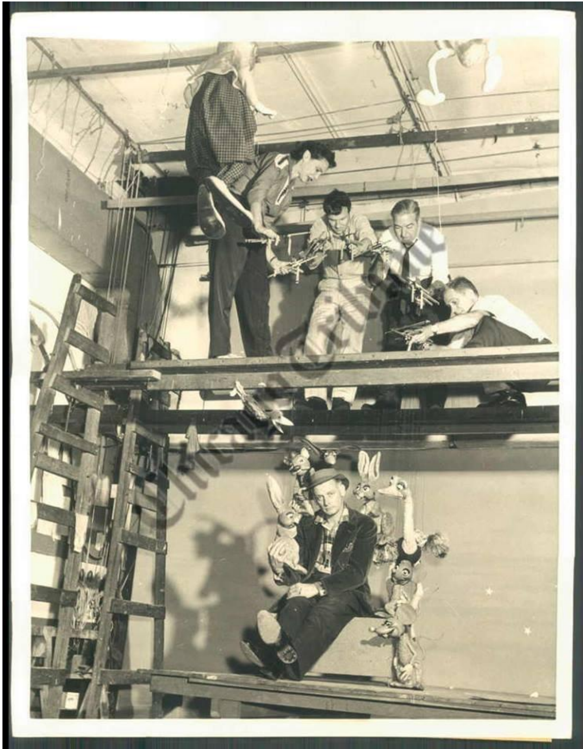
Los Baird realizaron una gira por India, Afganistán y Nepal para la Agencia de Información de los Estados Unidos y una gira por Rusia para el programa de