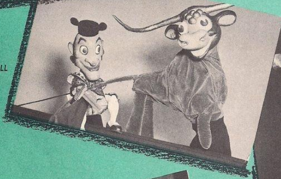
CARMEN A LA BULL