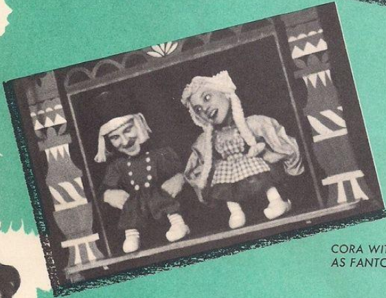
CORA WITH FRANZ FAZAKAS AS FANTOCHE